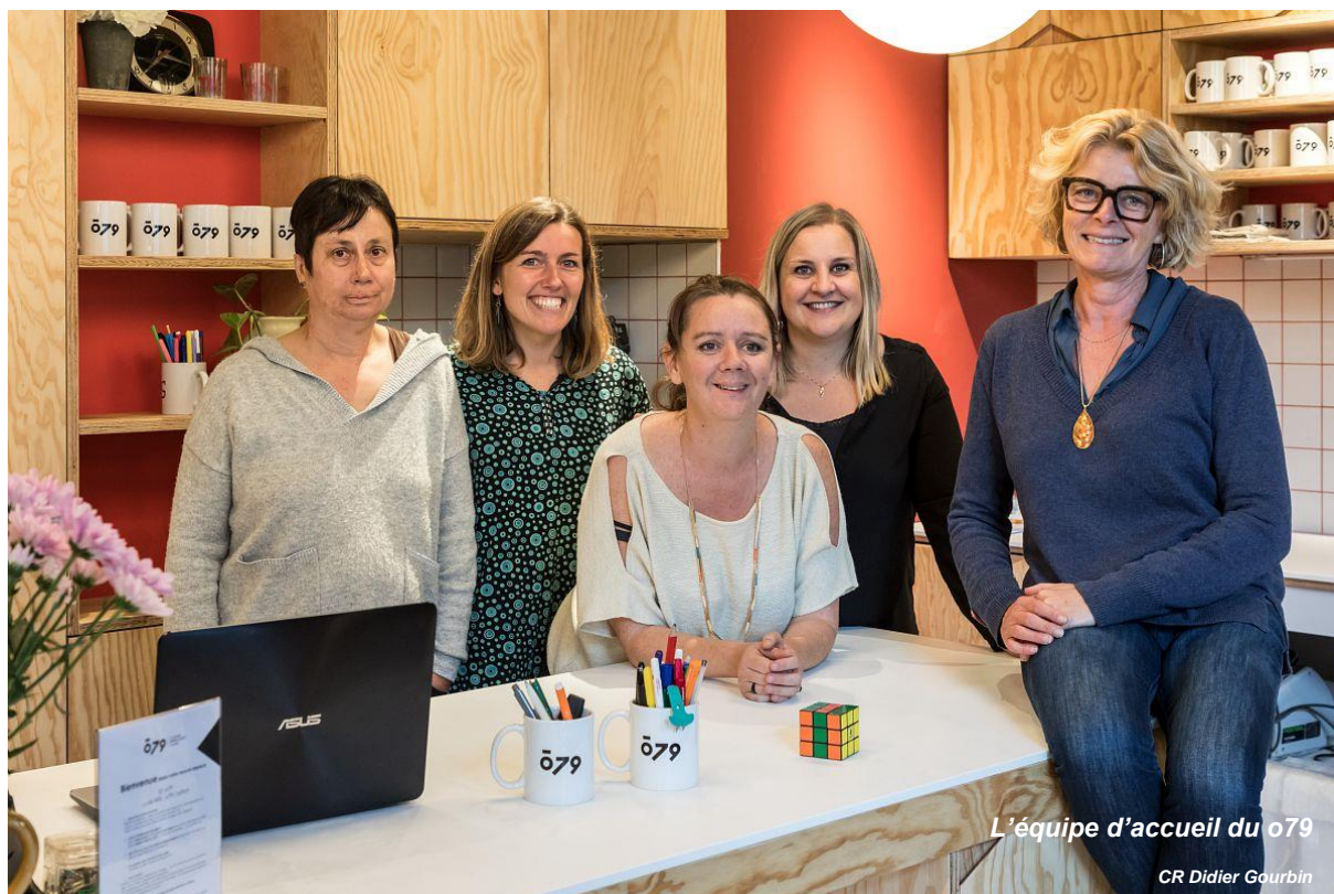
L'équipe d'accueil du o79

Chambé-Carnet et autres réseaux. Les 16/25 ans bénéficient d'un accompagnement privilégié avec les services et les conseils avisés de l'équipe de Savoie information jeunesse en matière de médiation numérique et d'éducatons aux médias. Le o79, c'est un futur lieu « boussole » pour mieux se repérer à l'ère de nos vies de plus en plus numériques.