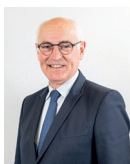
Thierry Repentin Ancien ministre des Affaires européennes Maire de Chambéry