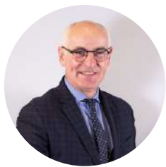
Thierry Repentin Maire de Chambéry

À Chambéry, nous faisons le choix simple et exigeant de placer la ville à hauteur d’enfant. Notre Projet Éducatif de Territoire 2025-2030 porte cette ambition et fixe un cap partagé, clair et lisible, pour l’ensemble de la communauté éducative. Il embrasse tous les temps et tous les âges de la vie de l’enfant et du jeune, du tout-petit à l’entrée dans l’âge adulte, afin d’assurer un véritable continuum éducatif de 0 à 25 ans.