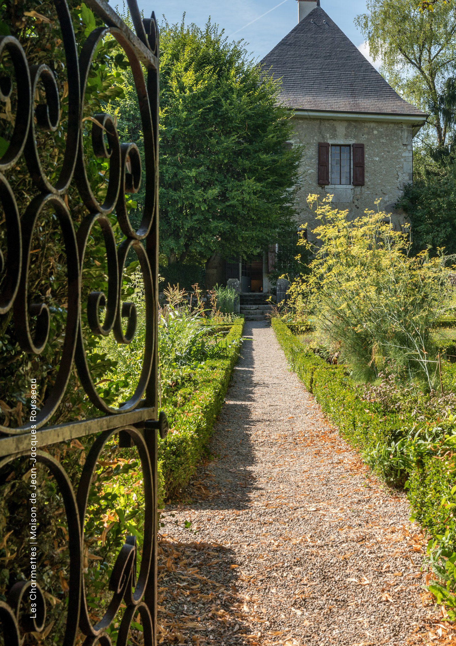
Les Charmettes | Maison de Jean-Jacques Rousseau