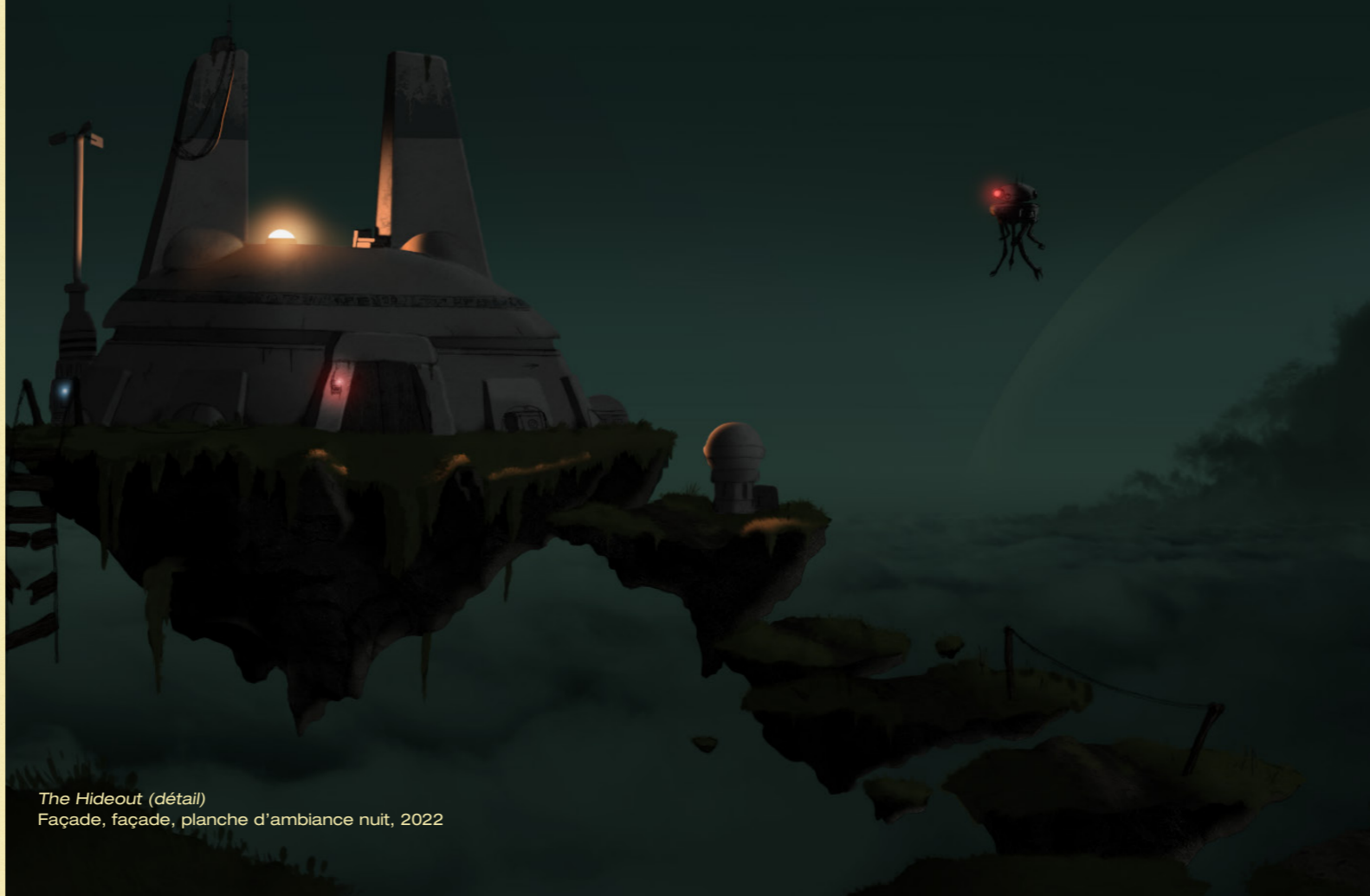
The Hideout (détail) Façade, façade, planche d'ambiance nuit, 2022