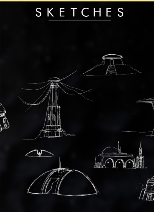
Sketches (détail) Croquis préparatoire, 2023