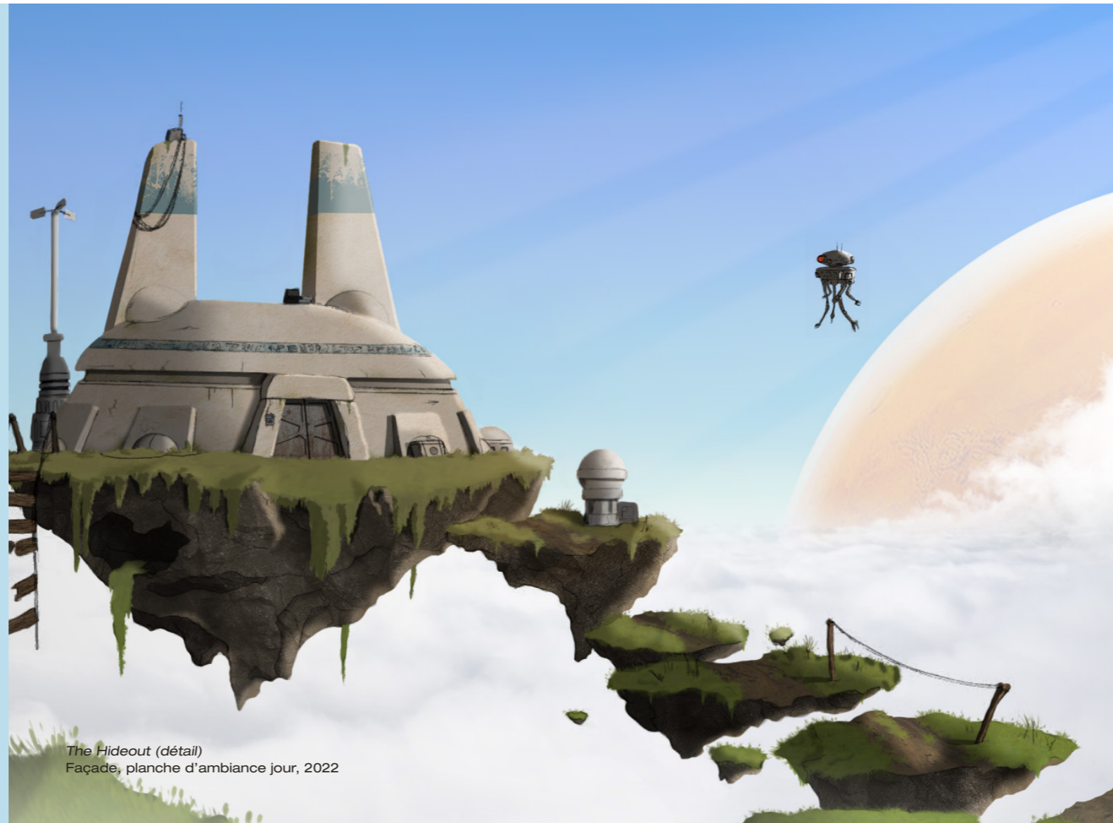
The Hideout (détail) Façade, planche d'ambiance jour, 2022

2023 - 2024 | ESMA, Lyon (4 ème année) 2019 - 2020 | École municipale d'Art