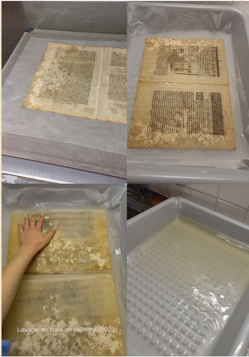
Lavage en bain de feuillets, 2023