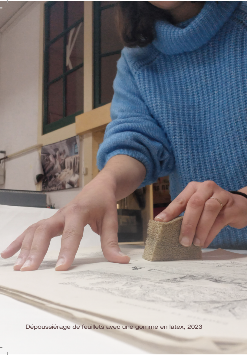
Dépoussiérage de feuillets avec une gomme en latex, 2023