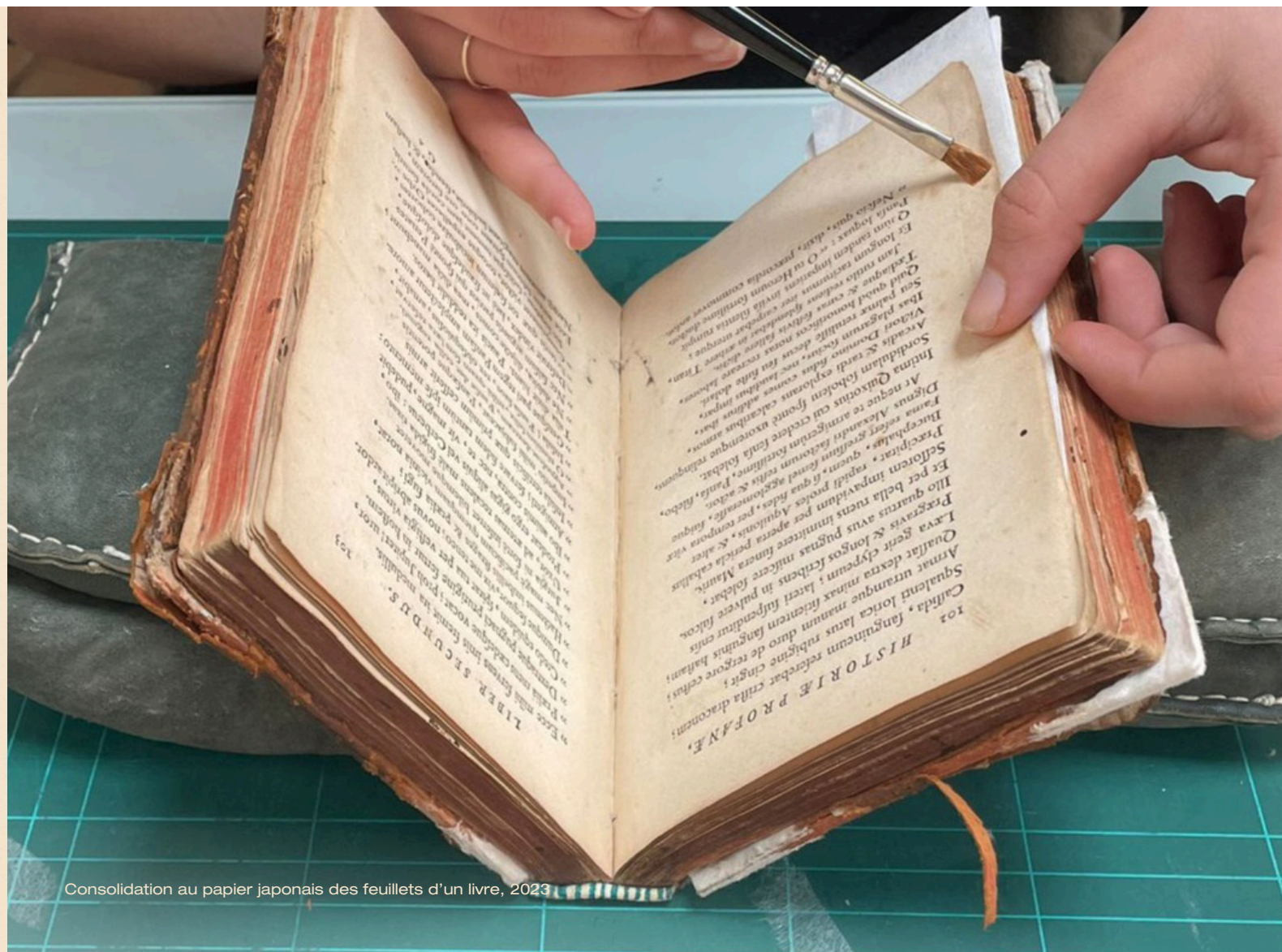
Consolidation au papier japonais des feuillets d'un livre, 2023

Suite à ma formation je souhaiterais ouvrir mon propre atelier de restauration afin de pérenniser le patrimoine écrit ! »