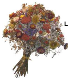
L'artisanat floral , avec ici, des bouquets de fleurs séchées.

La présentation de toutes les différentes facettes des paysages qui composent le massif des Bauges traduit la diversité des produits, l'attachement des agriculteurs et des forestiers à leur terre, de même que celui de tous ceux qui animent le territoire et lui donnent son âme si particulière.