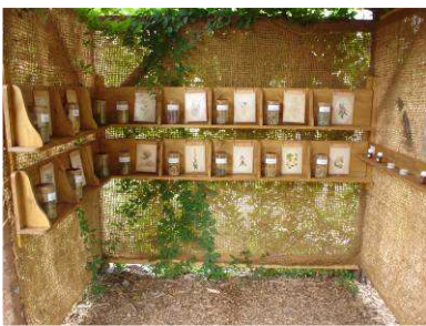
L'exposition « les sens des plantes », dans le jardin de la Maison Faune-Flore.