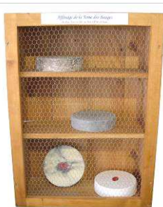
La Tome des Bauges A.O.C. (Appellation d'Origine Contrôlée) depuis 2002, la Tome des Bauges est ici présentée à divers stades d'affinage.

les processus de fabrication du goût, nos fromages et autres produits du terroir sont inimitables. Maintenir une agriculture dynamique sur le territoire afin de conserver une véritable biodiversité des prairies, tel est l'enjeu de demain.