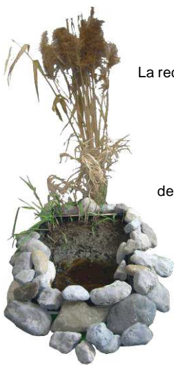
La reconstitution d'une mini-station à macrophytes évoque cette technique d'épuration respectueuse de l'environnement.

Les plantes jouent un rôle important dans l'épuration des matières organiques. Grâce aux stations à lits à macrophytes, la respiration des plantes par les tiges et les racines apporte l'oxygène indispensable aux milieux humides.