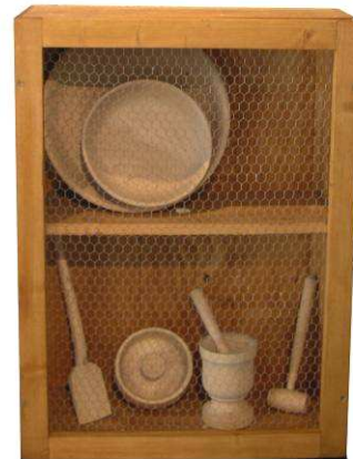
L'argenterie des Bauges Le tournage de cette vaisselle utilitaire en bois est un artisanat traditionnel du Massif des Bauges.

Matériau durable, il est un combustible d'avenir et sûrement une solution énergétique d'alternative.