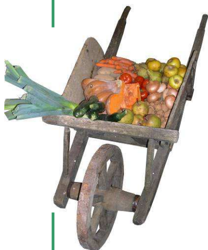
Dans la brouette, des produits du terroir de saison.

Il illustre, valorise les produits du terroir et insiste sur les modes de consommation directe entre producteurs et consommateurs. Il sensibilise également à l'importance d'avoir une alimentation saine au quotidien.