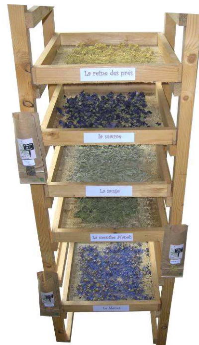
Le séchoir Les parties de certaines plantes vous attendent sur le séchoir.

La phytothérapie est la plus ancienne médecine de l'humanité et revient au goût du jour. Sentez les plantes exposées et vous aurez sûrement envie de parcourir les chemins à leur découverte !