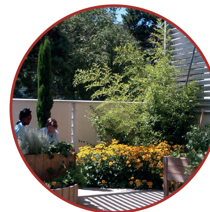
le jardin thérapeutique