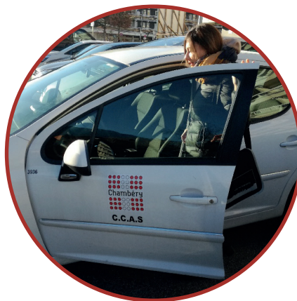
Départ au domicile d'un usager

A l'issue des séances, un relais est initié par l'équipe vers d'autres professionnels, et un bilan final est envoyé au médecin prescripteur.