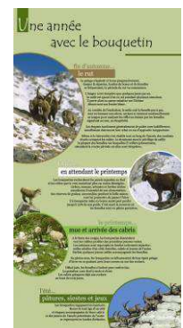
Une année avec le bouquetin A chaque saison son actualité.