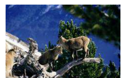
Cabris en très grand format