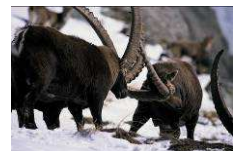
Combat rituel entre mâles