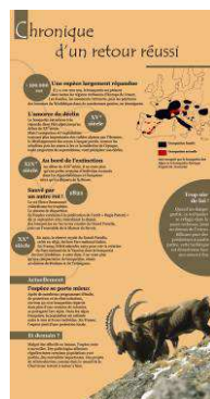
Chronique d'un retour réussi Historique de l'espèce de -100 000 ans à nos jours et demain ?