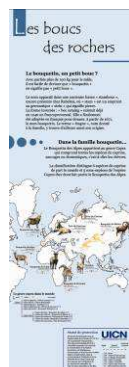
Les boucs des rochers Origine du nom « bouquetin » et répartition de la famille bouquetin dans le monde avec leur statut de protection UICN.