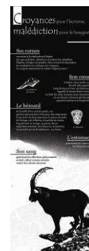
Croyances pour l'Homme, malédiction pour le bouquetin De ses cornes à son sang en passant par le bézoard et son cœur, de nombreuses parties du corps de l'animal étaient recherchées.