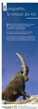
Bouquetin, le retour du roi Panneau titre