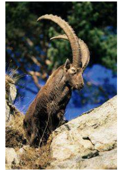
Bouc en très grand format