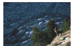
Mâle contemplant la ville de Modane

Vol d'un gypaète au dessus d'une harde composée d'étagnes et de cabris