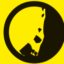
Mouvements de terrain