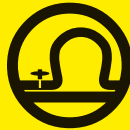
Transport de matières dangereuses par canalisation