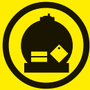
Transport de matières dangereuses par voie routière ou ferroviaire