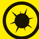
Risques épidémiques, maladies contagieuses, pandémie grippale