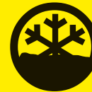
Risques météorologiques (fortes chutes de neige, canicule, tempête)