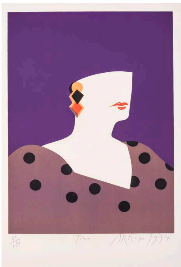
Eduardo Arroyo, Tina , 1974 Album Opus 50, sérigraphie n°61 / 150 Artothèque de Chambéry