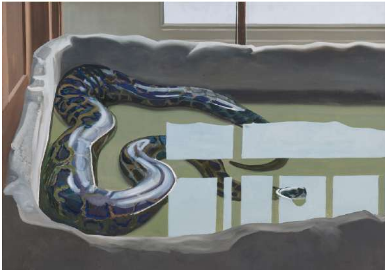
Gilles Aillaud, Python dans l'eau , 1976