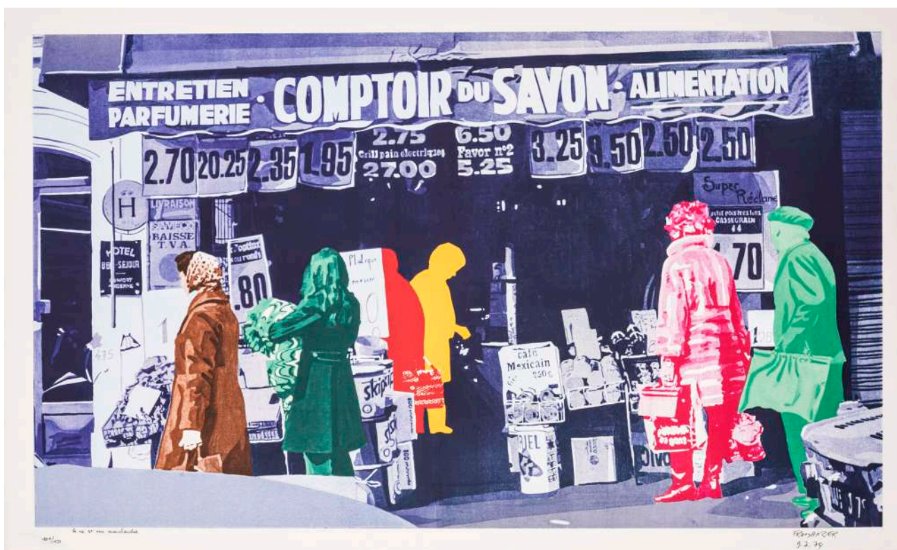
Gérard Fromanger, La vie est une marchandise , 1974, Album Opus 50, lithographie, n°101/150 Artothèque de Chambéry