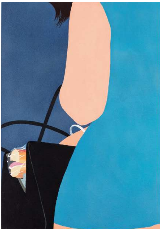
Gérard Schlosser, Le trousseau de clefs , 1969

Acrylique sur toile sablée, 146 x 114 cm