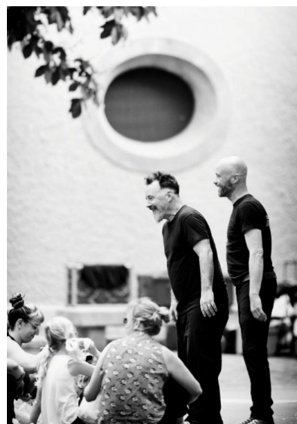
Les Misérables