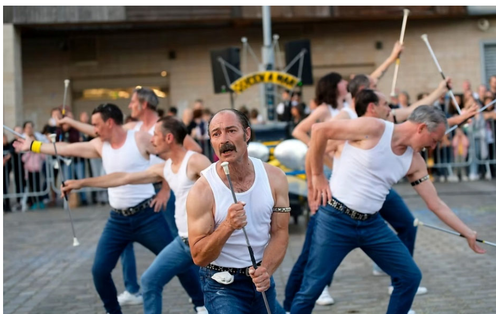
Queen-A-Man © Philippe-de-Ram