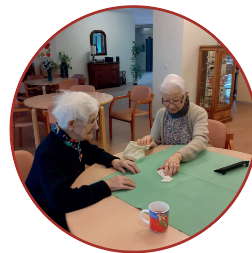
Atelier jeux de société