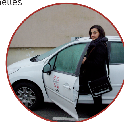
Départ au domicile d'un usager