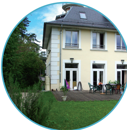
Les résidents ont accès au jardin et sa terrasse